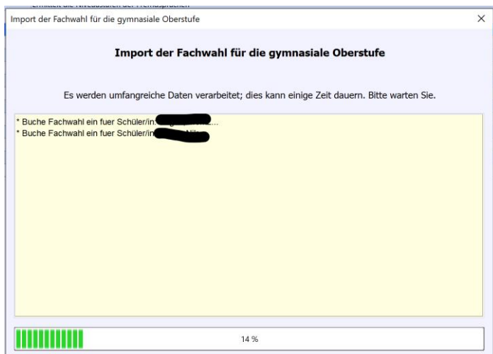
Abb.13: So sieht die Ansicht während des Imports in der ASV aus.

Läuft der Import offensichtlich nicht mehr weiter, dann brechen Sie ab. Der letzte im Importfenster aufgeführte Schüler erzeugt den Fehler. Dessen Wahl muss in QWahl überprüft und korrigiert werden. In der Regel ist ein nicht zugeordnetes Fach fehlerhaft oder eine gewählte Lehrplanalternative ist in der ASV nicht angegeben.